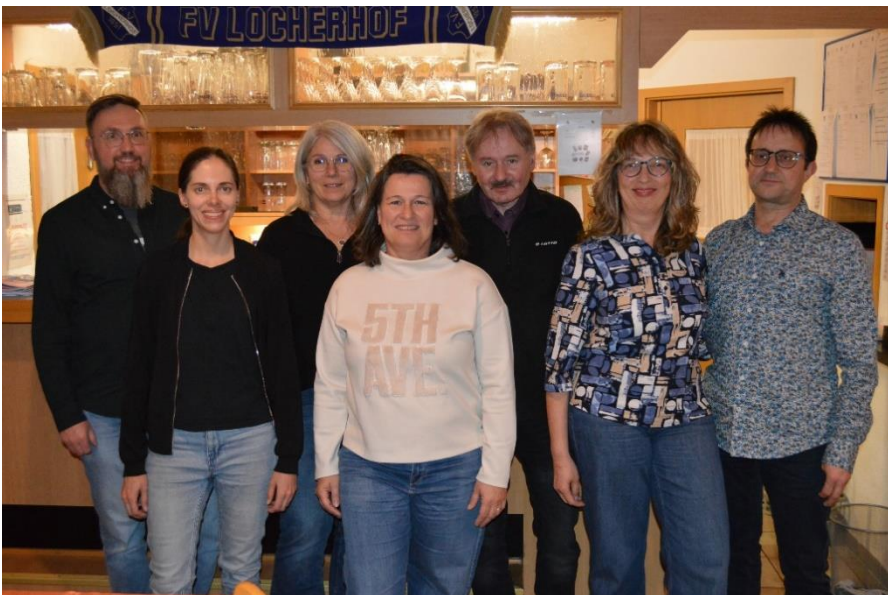
Wiedergewählte Ausschussmitglieder auf der Jahreshauptversammlung am 27.03.2026

Die vollständigen Adressdaten und Telefonnummern gibt es in der gedruckten Ausgabe!