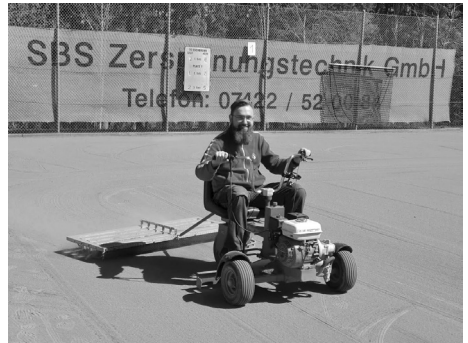
. . . aber der Vorstand kann es auch.