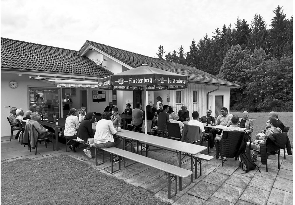
Erste Freiluft-Generallversammlung des TCE 2021, wegen Corona